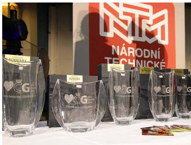
Český Goodwill 2014: slavnostní vyhlášení se uskutečnilo v Národním technickém muzeu v Praze.